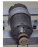
Figura 4: Gerador.