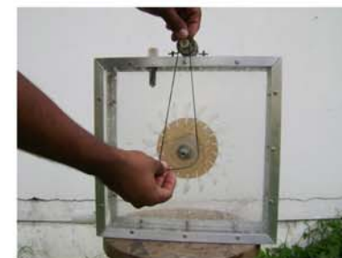
Figura 5: Instalação da correia.