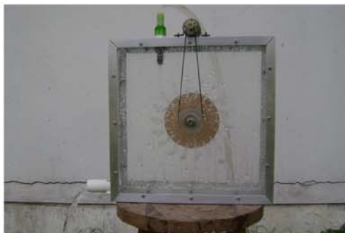
Figura 8: Operação do kit.

INSTITUTO NACIONAL DE CIÊNCIA E TECNOLOGIA DE ENERGIAS RENOVÁVEIS E EFICIÊNCIA ENERGÉTICA DA AMAZÔNIA -- INCT - EREEA