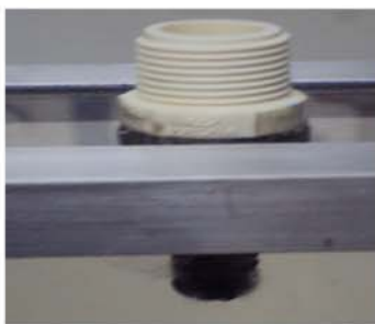
Figura 2: Duto de entrada de água.