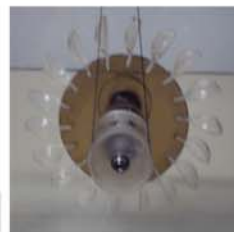
Figura 3: Turbina.