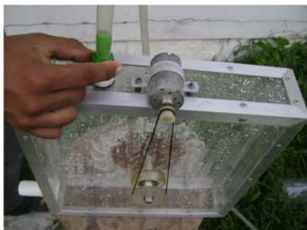
Figura 7: Abertura da torneira.

O desenvolvimento deste kit teve o apoio de: