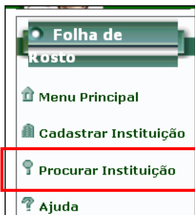
Janela de instituição Proponente